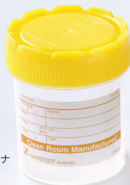
*専用滅菌容器 70cc 採精用コンテナ (別売り)