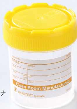
*専用滅菌容器 70cc 採精用コンテナ (別売り)