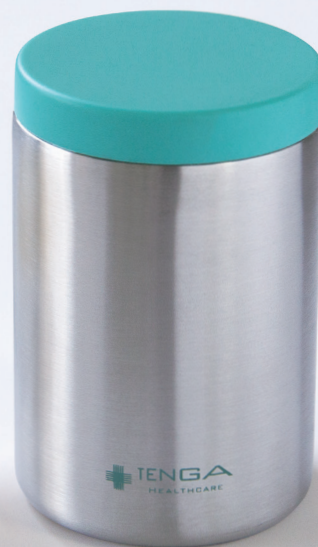
SEED POD 本体